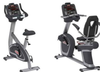
エアロバイク 2種類