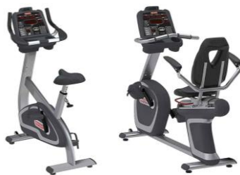
エアロバイク 2種類